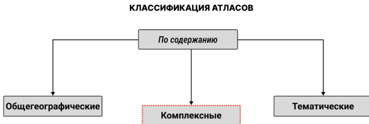
Рис. 1. Схема размещения атласа в общей классификации атласов по содержанию

Место разрабатываемого атласа в общей классификации атласов, представлено на рисунках 1–4.