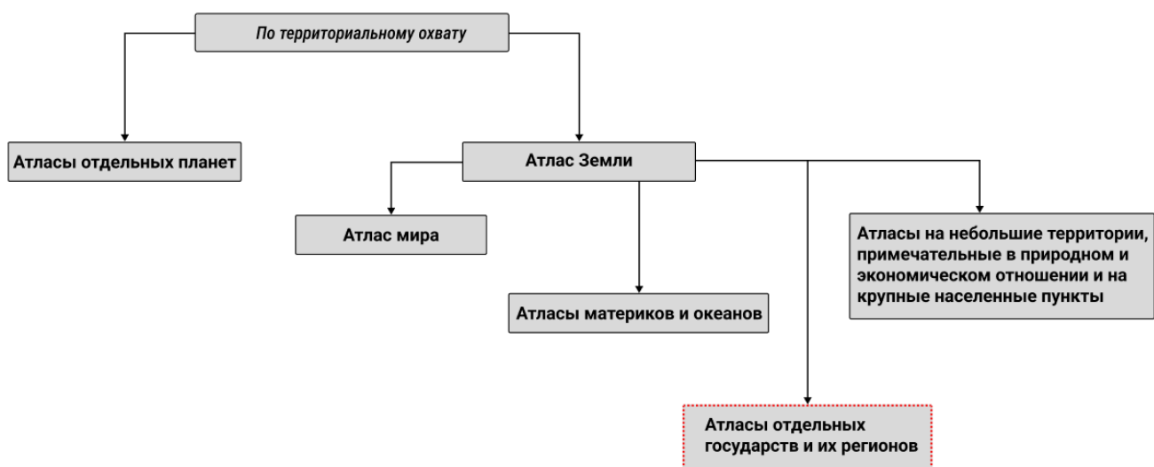
Рис. 2. Схема размещения атласа в общей классификации атласов по территориальному охвату