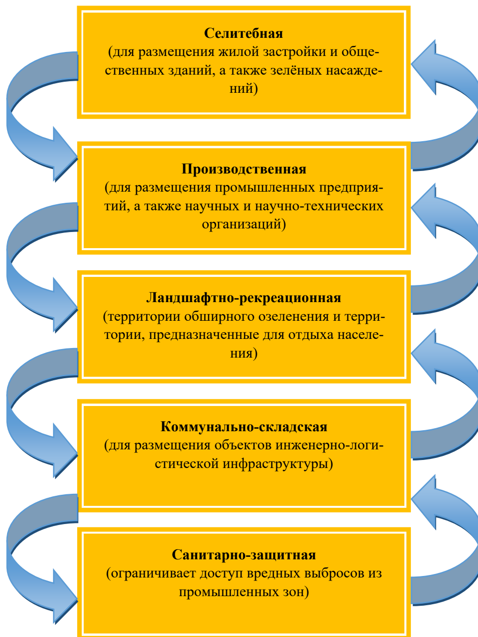
Рис. 2. Основные функциональные зоны населённых пунктов

Под функциональным зонированием понимают установление вида использования ряда территорий Кемеровского муниципального округа, а именно обособление функциональных зон [3]. Обычно выделяют следующие основные функциональные зоны населённых пунктов (рис. 2):