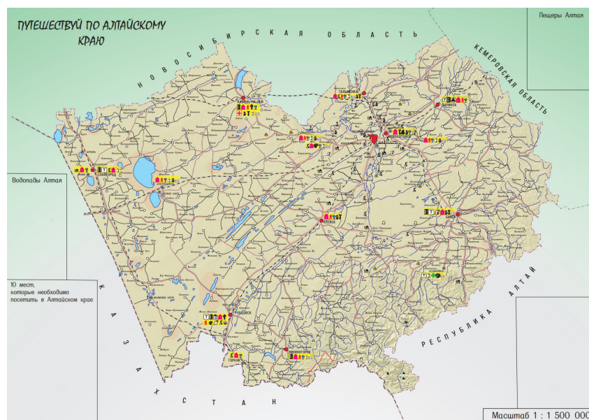
Рис. 4. Авторский оригинал карты и макет компоновки листа буклета

Разработанный авторский оригинал карты Алтайского края и макет компоновки представлен на рисунке 4.