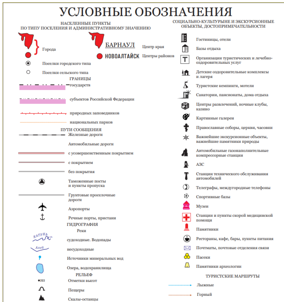
Рис. 3. Условные обозначения

Разработаны условные обозначения, представленные в легенде карты на рисунке 3.