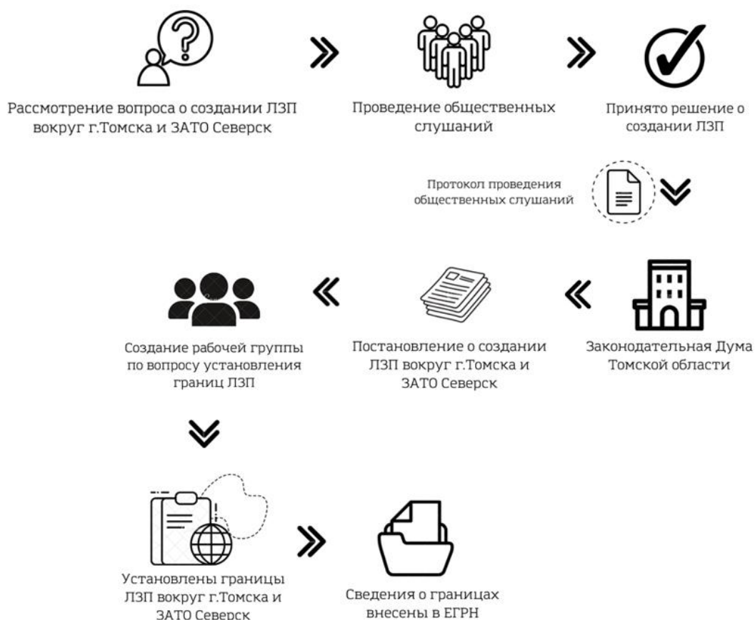
Рис. 4. Технологическая схема создания лесопаркового зеленого пояса вокруг города Томска и ЗАТО Северск

Проанализировав порядок создания лесопаркового зеленого пояса вокруг г. Томска и ЗАТО Северск, была составлена технологическая схема такого создания (рис. 4).