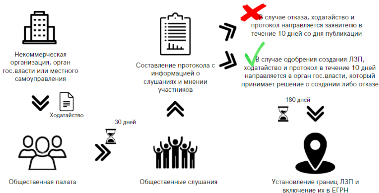
Рис.1. Общий порядок создания лесопаркового зеленого пояса

На первом этапе был поднят вопрос о создании лесопаркового зеленого пояса в Томской области. Данная проблема рассматривалась Общественной палатой Томской области совместно с региональным отделением Общероссийского Народного Фонда. Далее были проведены общественные слушания, в которых приняли участие 35 человек, и по итогам которых было принято решение о создании лесопаркового зеленого пояса вокруг г. Томска и ЗАТО Северск.