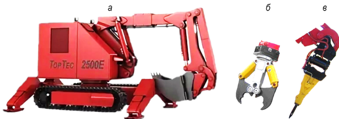
Рис. 3. Демонтажный робот с комплектом рабочего оборудования

Особый класс машин представляют демонтажные роботы с дистанционным управлением [12]. Изначально они предназначались для использования в строительной отрасли, однако благодаря своим качествам, находят все большее применение и в горнодобывающем кластере. Так немецкая фирма TopTec разработала и выпускает роботизированное демонтажное оборудование, рассчитанное на эксплуатацию в сложных условиях горных выработок [13]. В качестве сменного быстросъемного рабочего органа используется экскаваторный ковш обратной лопаты, гидромолот, челюстной захват (рис. 3а - в). Такая комплектация позволяет выполнять разборку завалов, погрузку породы в транспортные средства, дробление негабаритов, зарядание скважин взрывчатым веществом в незакрепленных выработках.