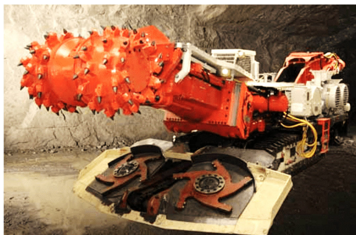
Рис. 4. Роботизированный проходческий комбайн Alpine AM-105

высокий уровень автоматизации оборудования и производственного процесса в целом, отпадает необходимость нахождения оператора непосредственно в зоне забоя, повышается производительность и эффективность использования дорогостоящей добычной техники. При этом система AutoMine от Sandvik объединяется с программами планирования производства работ для лучшей их совместимости с процессами управления операциями подземных горных работ. Это обеспечивает постоянную загруженность добычных комплексов в течение всей смены, сокращение простоев оборудования и уменьшение затрат на его техническое обслуживание.