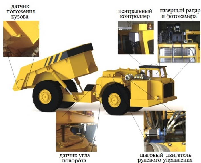
Рис. 8. Распределение датчиков для беспилотного вождения

Основным отличием таких автомобилей является их способность двигаться вперед и назад с равной скоростью, полный привод и управление, как вращением всеми четырьмя колесами, так и их поворотом. Вследствие этого уменьшается время на постановку под погрузку и выгрузку. Кроме того, отсутствие необходимости в развороте автомобиля существенно экономит место в призабойной и разгрузочной зонах и требуется минимум вскрышных работ. Использование в управлении транспортными средствами лидаров, радаров, ультразвуковых датчиков и оптико-электронной системы (рис. 8) обеспечивает точность позициони-