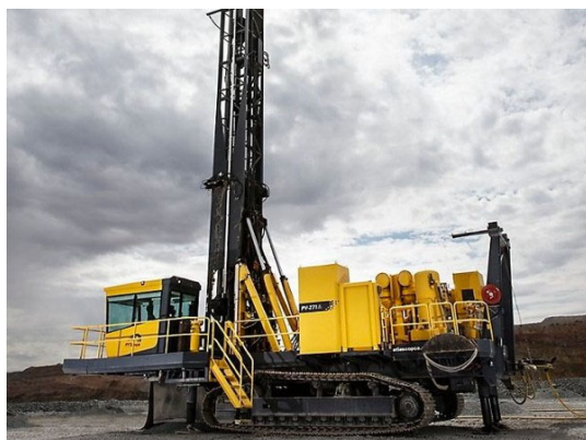
Рис. 6. Роботизированный буровой станок

ударниками высокого давления программное обеспечение и комплекс телематики, базирующийся на GPS-позиционировании [15]. При этом для оптимизации скорости процесса подбирается оптимальное сочетание энергии и частоты ударов пневмоударного механизма, скорости вращения и усилия подачи бурового става в зависимости от глубины и диаметра бурения (рис. 5) [16]. После выбора площадки для проведения работ оператором и получения от него соответствующей команды робот в автономном режиме перемещается в заданную точку, осуществляет бурение, загружает взрывчатку, собирает данные с участка и передает их в диспетчерский пункт.