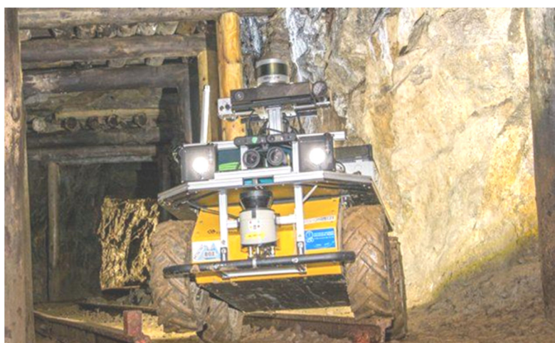
Рис. 2. Робот разведчик на пневмоколесном ходу