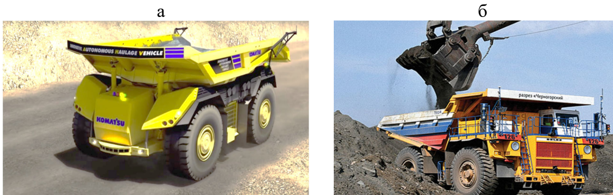
Рис. 7. Роботизированный автомобильный транспорт: Komatsu 930E-4AT (а) и Белаз-75137R (б)

чество роботизированных большегрузных автомобилей, работающих в горной промышленности по всему миру, исчисляется сотнями. В 2016 году компания Komatsu представила свой инновационный проект - автономный карьерный самосвал без кабины водителя, которого заменил центральный контроллер. При этом существенно изменена компоновка и эргономика машины (рис. 7а).