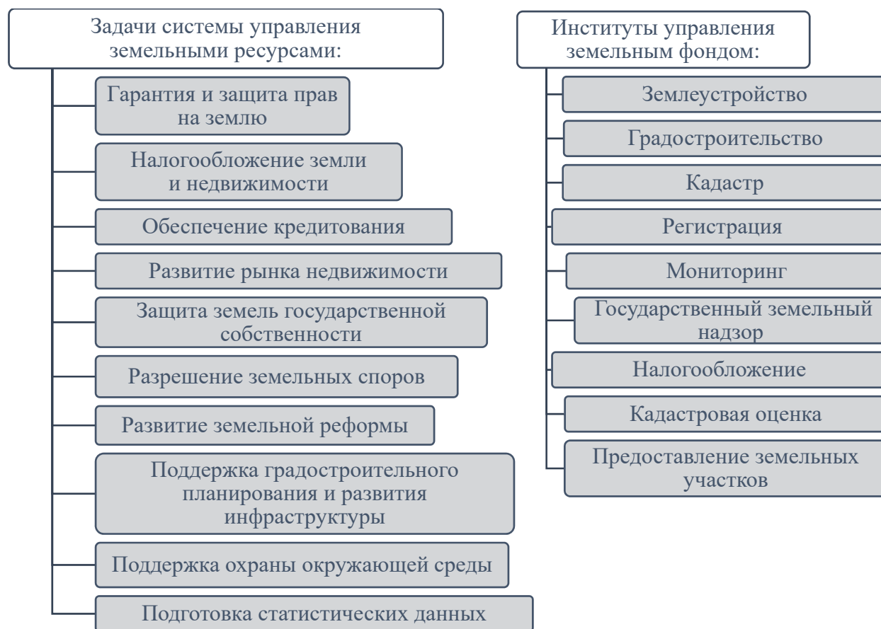
Рис. 2. Задачи системы управления земельными ресурсами

и реализующие их институты управления земельным фондом представлены на рис. 2.