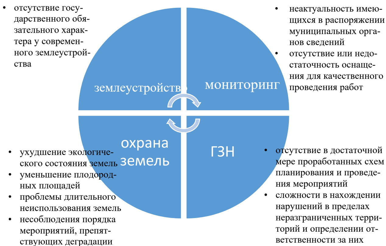
Рис. 3. Основные проблемы государственной земельной политики

Сферы мониторинга земель и государственного земельного надзора сталкиваются со схожими проблемами. Трудностями при достижении природоохранных целей являются отсутствие в достаточной мере проработанных схем планирования и проведения мероприятий, неактуальность имеющихся в распоряжении муниципальных органов сведений, отсутствие или недостаточность программно-технического оснащения для качественного проведения работ, сложности в выявлении нарушений и определении ответственности за них, неэффективная санкционная политика государства, а также отсутствие государственного обязательного характера у современного землеустройства [18, 20]. Основные проблемы современной земельной политики представлены на рис. 3.