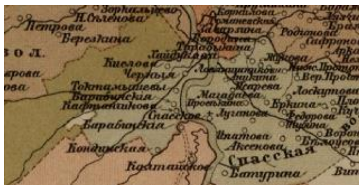
Рис. 1. Фрагмент карты Томского округа 1890-х гг.

Подводя итог, необходимо отметить, что использование картографических материалов при изучении социально-экономического развития сельских поселений Томского округа-уезда является необходимым условием создания пространственного представления об изучаемых процессах. Совокупность факторов, повлиявших на становление и развитие поселений, их социокультурной и производственной специализации оказываются прямым отражением деятельности государства и конкретных сельских обществ по заселению рассматриваемой территории. Картографические издания, которые несут информацию о социально-экономическом состоянии сельских населенных пунктов, открывают возможность более полного и объективного исследования проблемы развития сельской поселенческой сети.