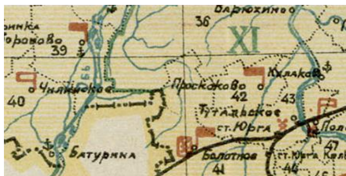
Рис. 3. Фрагмент карты Томской губернии 1923 г.

Статья выполнена при финансовой поддержке гранта РФФИ в рамках научного проекта № 19-49-540002 р_а «Электронный архив рукописных и печатных карт Сибири и Дальнего Востока с конца XVII в. по 1941 г.».