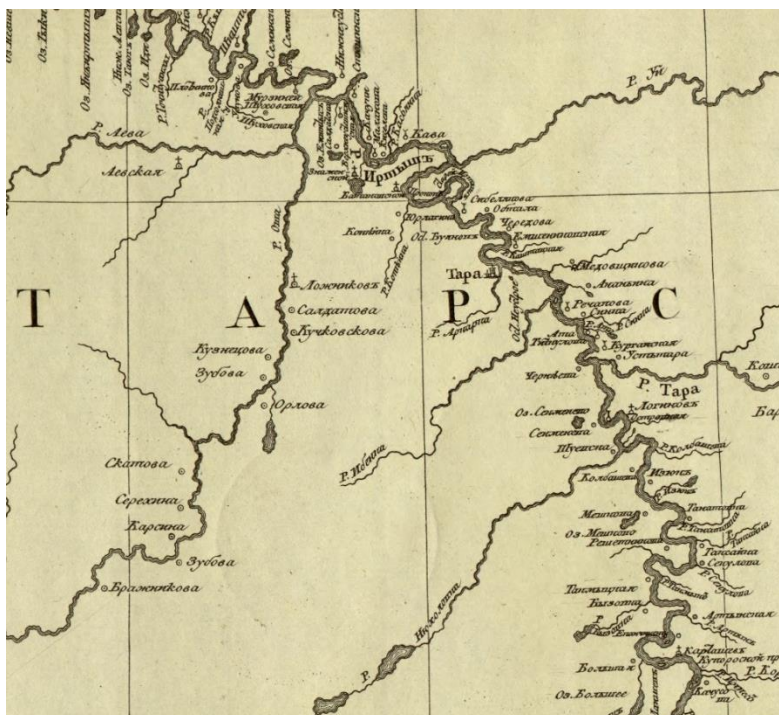
Рис. 2. Фрагмент карты реки Иртыш от Омской крепости до Тобольска.

В отличие от железнодорожных или дорожных карт, карты водных путей сообщения показывают населенные пункты только близ рек. Из таких можно назвать Карту течения реки Иртыш от Омской крепости до Тобольска 1780 г. (рис. 2.) [16].