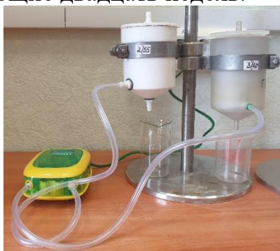
Рис.1. Схема эксперимента

г) начинаются следующие двадцать недель.