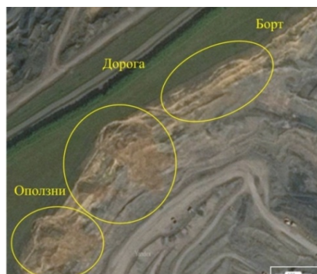
Рис. 1. Вид оползней борта карьера на карте Викимапии

Как показано в [3, 4], эрозионные разрушения в бортах карьера проявляются при морозобойном растрескивании грунтов и пород в краевой части массива, когда при промерзании сухих грунтов происходит их объемное уменьшение, сопровождающееся образованием трещин и щелей, ориентированных по глубине вертикально или под углами напластований (рис. 2). Пучение влагонасыщенных грунтов и разрушение пород при сезонном замерзании воды, скапливающейся в трещинах и порах вблизи поверхности обнажений, приводит к увеличению объема грунта до 10%, инициируя необратимые деформации в массиве.