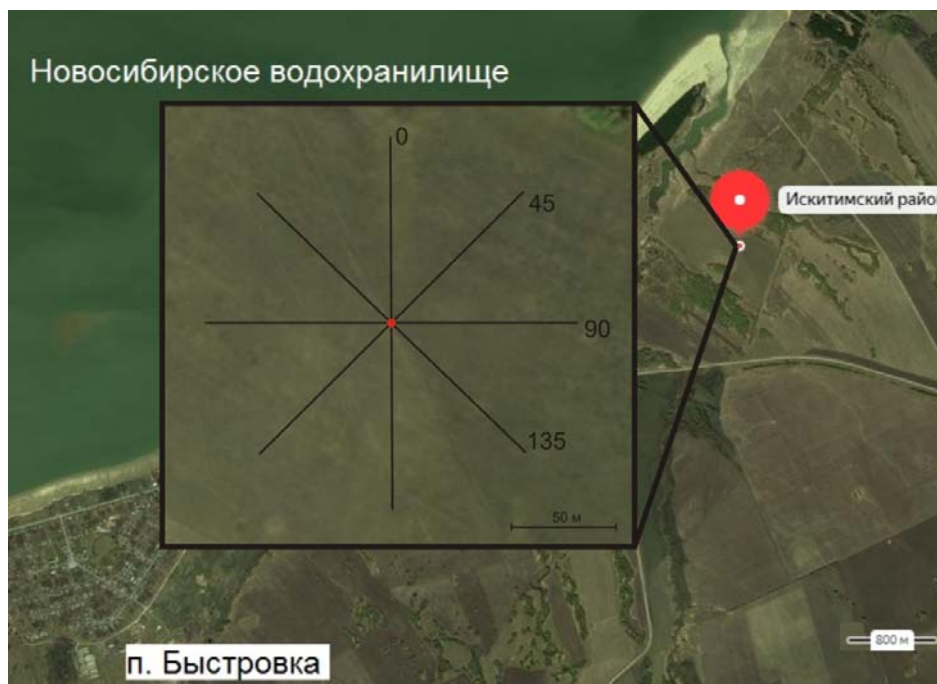
Рис. 1. Участок исследования и схема измерений методами геоэлектрики

Участок исследования расположен в Искитимском районе Новосибирской области, недалеко от п. Быстровка. Исследование анизотропии в районе Быстровского полигона были выполнены с использованием двух методов постоянного тока: электротомографии (ЭТ) и вертикального электрического зондирования (ВЭЗ) по методике круговых наблюдений (рис. 1). Комплексирование методов постоянного тока выполнено для более надежного определения параметров геоэлектрической модели и для контроля измерений.