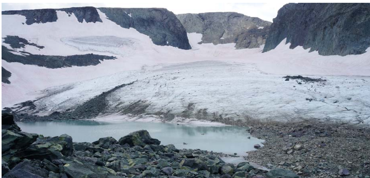
Рис. 1. Ледник Иган.